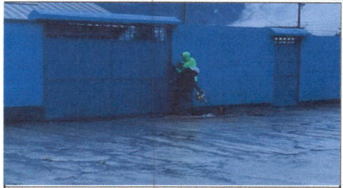
Foto 2: sustitución de porton de madera y lamina por porton de metal principal