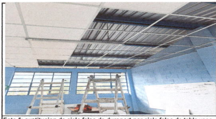
Foto 5: sustitucion de cielo falso de duroport por cielo falso de tabla yeso