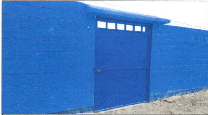
Foto 1: sustitución de puerta de metal por puerta de metal principal