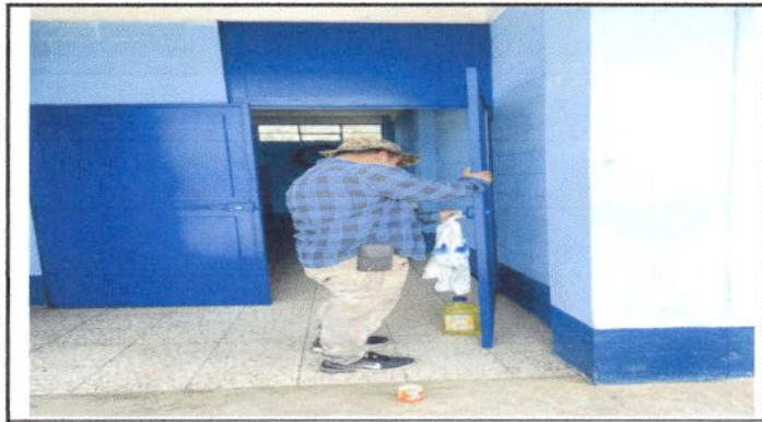
Foto 3: mantenimiento de pintura y estructuras a 9 puertas y cambio de dos chapas